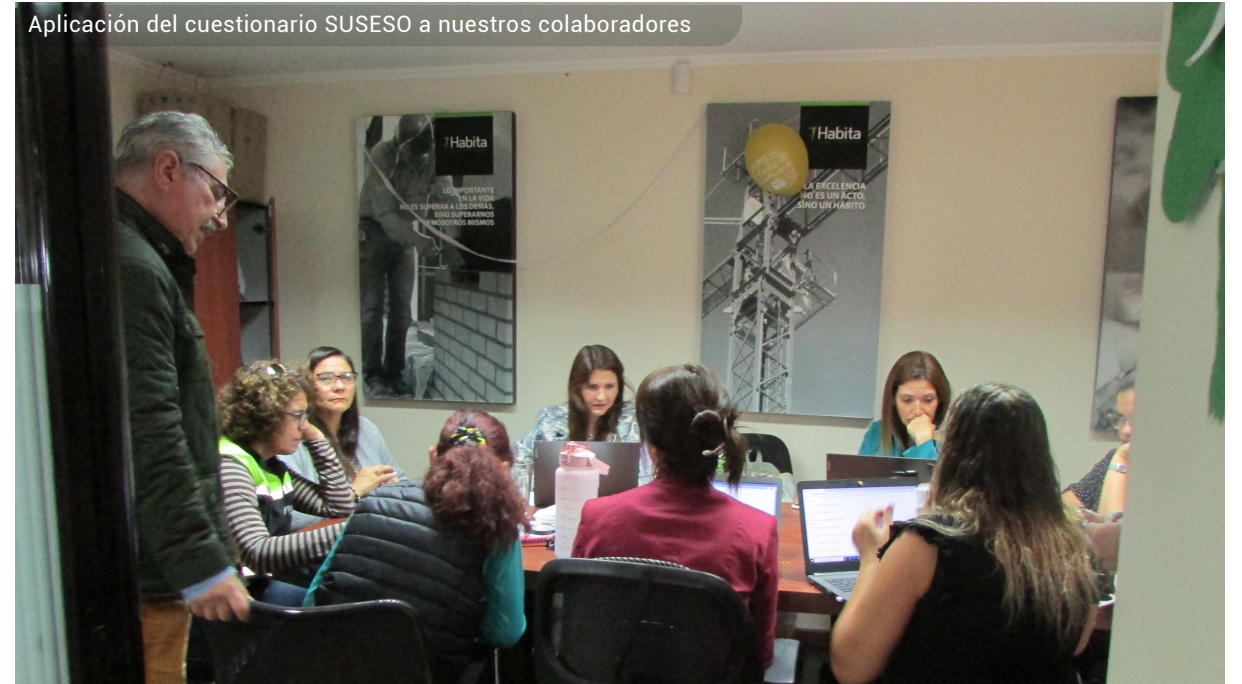
Aplicación del cuestionario SUSESOS a nuestros colaboradores

Generando efectos sobre la salud física y psicológica de los trabajadores