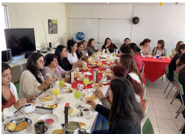
Participación de nuestras trabajadoras en el desayuno del 8M.